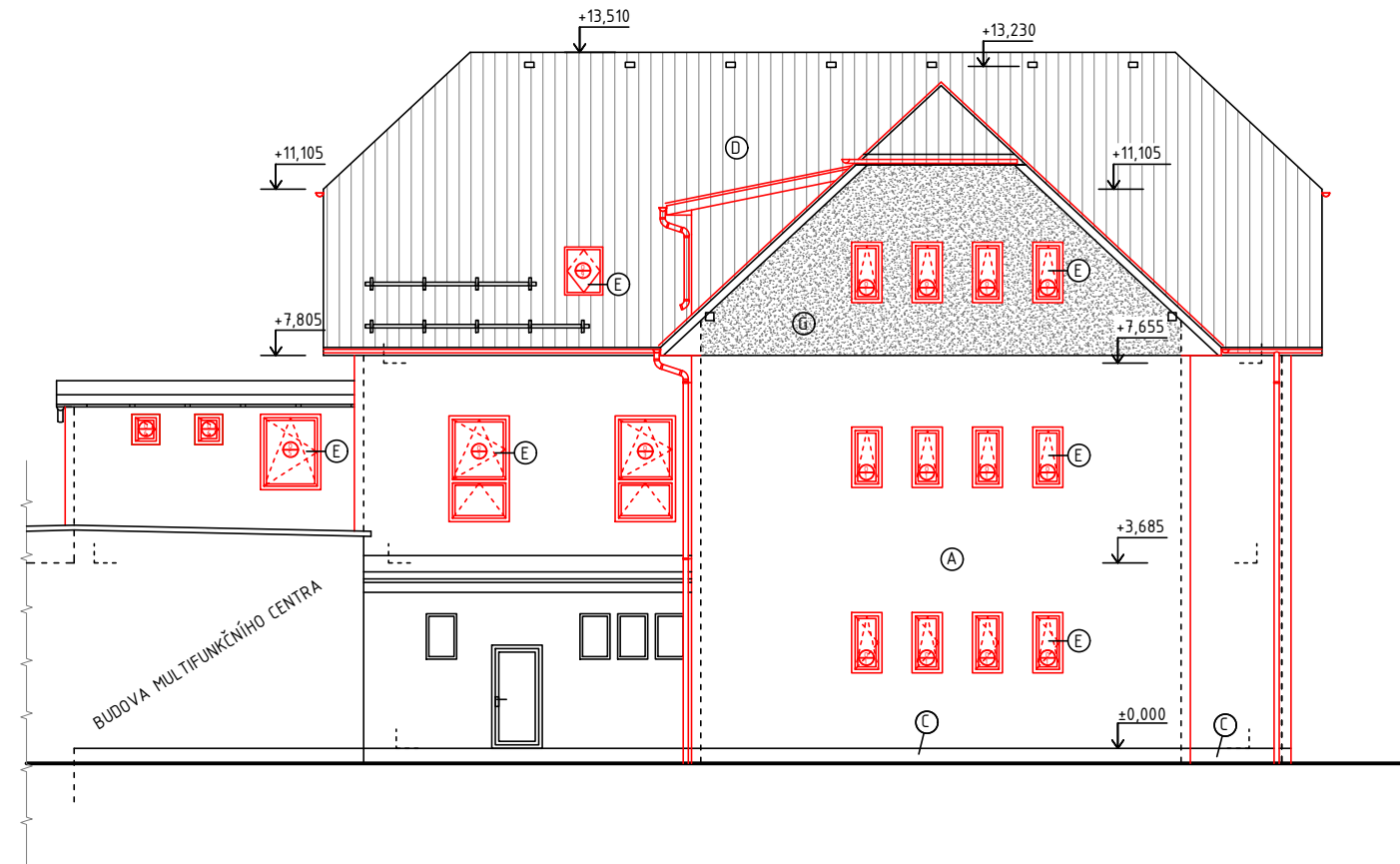
POHLED SEVERNÍ NAVRHOVANÝ STAV