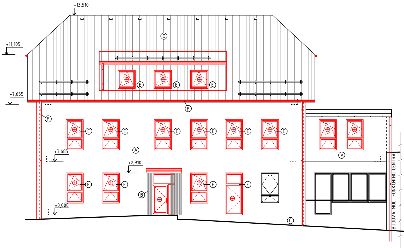
POHLED JIŽNÍ NAVRHOVANÝ STAV